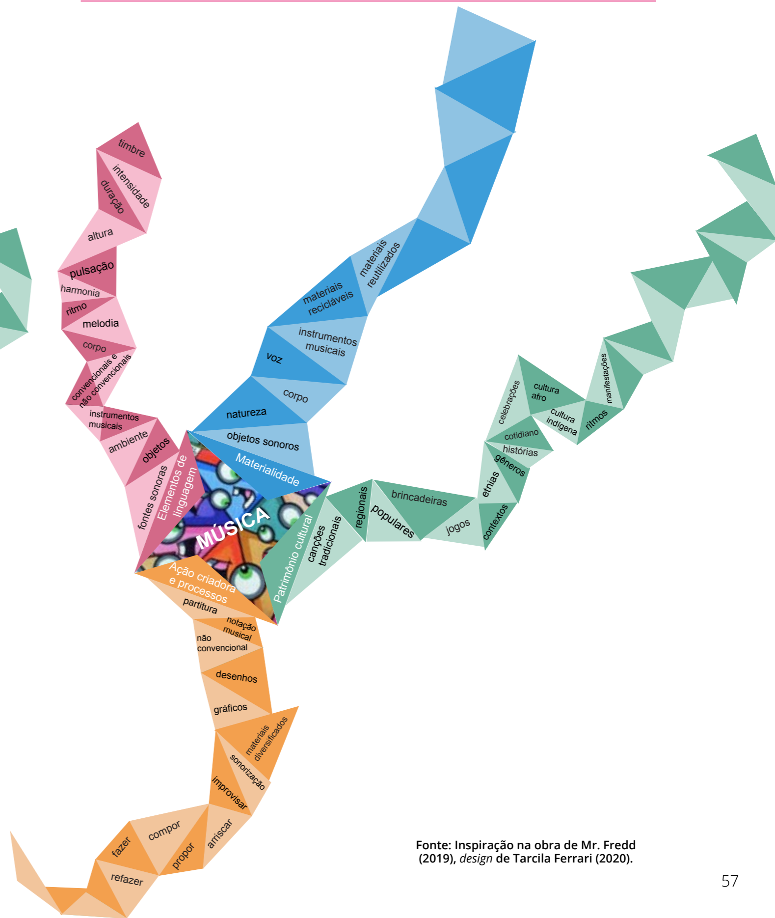
Fonte: Inspiração na obra de Mr. Fredd (2019), design de Tarcila Ferrari (2020).