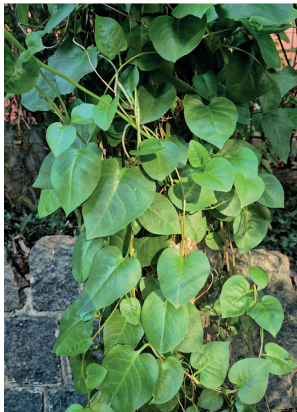
Folhas de Bertalha-coração ( Anredera cordifolia Ten.)