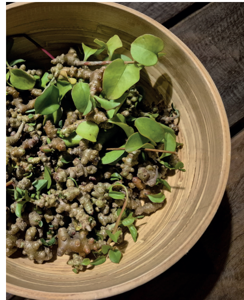
Bulbilhos de Bertalha-coração ( Anredera cordifolia Ten.)