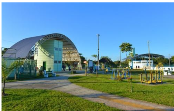
Centro Poliesportivo José Adailson Vieira Pinto

Fonte: Secretaria de Esporte e Qualidade de Vida – PMSJC – Elaboração SEURBS