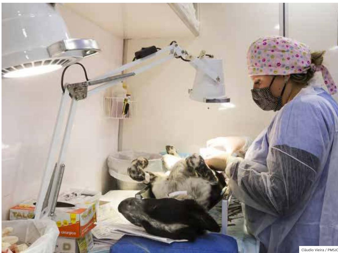
Renda. Ação beneficia milhares de famílias, principalmente as que não possuem condições financeiras

Ano de lançamento do programa Meu Pet Feliz, que realizou 15 mil cirurgias