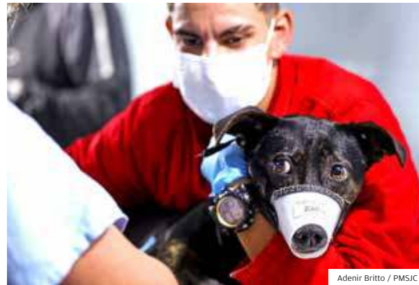
Programa. O Meu Pet Feliz surgiu em agosto de 2018