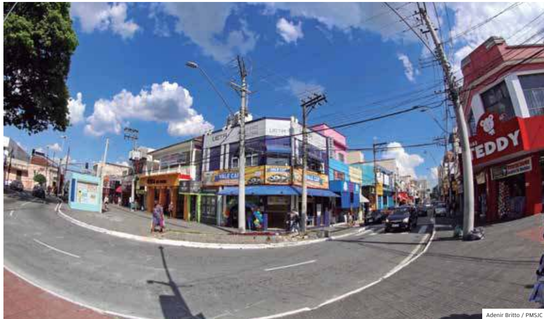
Na ponta. Revitalização da região central de S. José vai impulsionar a economia no coração da cidade