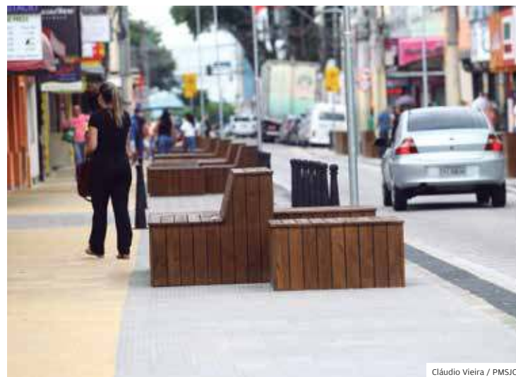
Nota 10. Obra enquadrada no conceito de ‘Ruas Completas’

85 EMPRESÁRIOS Com lojas instaladas em grandes eixos comerciais de São José foram ouvidos na pesquisa