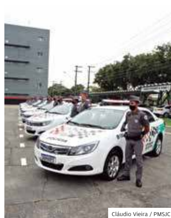
Serviço. Viaturas novas

POLÍCIA. A Prefeitura de São José dos Campos entregou 8 viaturas 100% elétricas para a Polícia Militar usar no programa Atividade Delegada. A entrega foi feita em evento no CPI-1. As viaturas são mais uma ferramenta que a Prefeitura oferece para as forças de segurança, dentro da parceria criada pelo programa São José Unida, para fortalecer a Atividade Delegada.