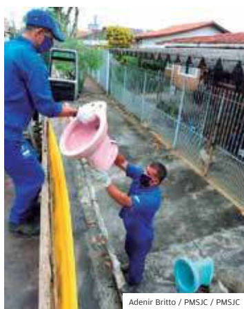
Zona leste. Ação nas casas

AÇÃO. A Prefeitura de São José dos Campos concluiu, em 20 de fevereiro, a primeira Operação Casa Limpa de 2022 e recolheu 5,040 quilos de materiais que poderiam servir de criadouros do mosquito transmissor da dengue, chikungunya e zika. A ação da Secretaria de Saúde aconteceu na região do Bairrinho, Capão Grosso, Jardim Castanheira e adjacências, na região leste.