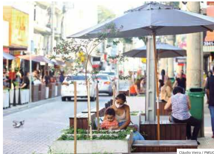
Centro. Rua Coronel José Monteiro já foi requalificada