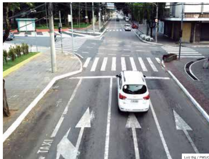
Como está. Trecho do Largo São Benedito será revitalizado