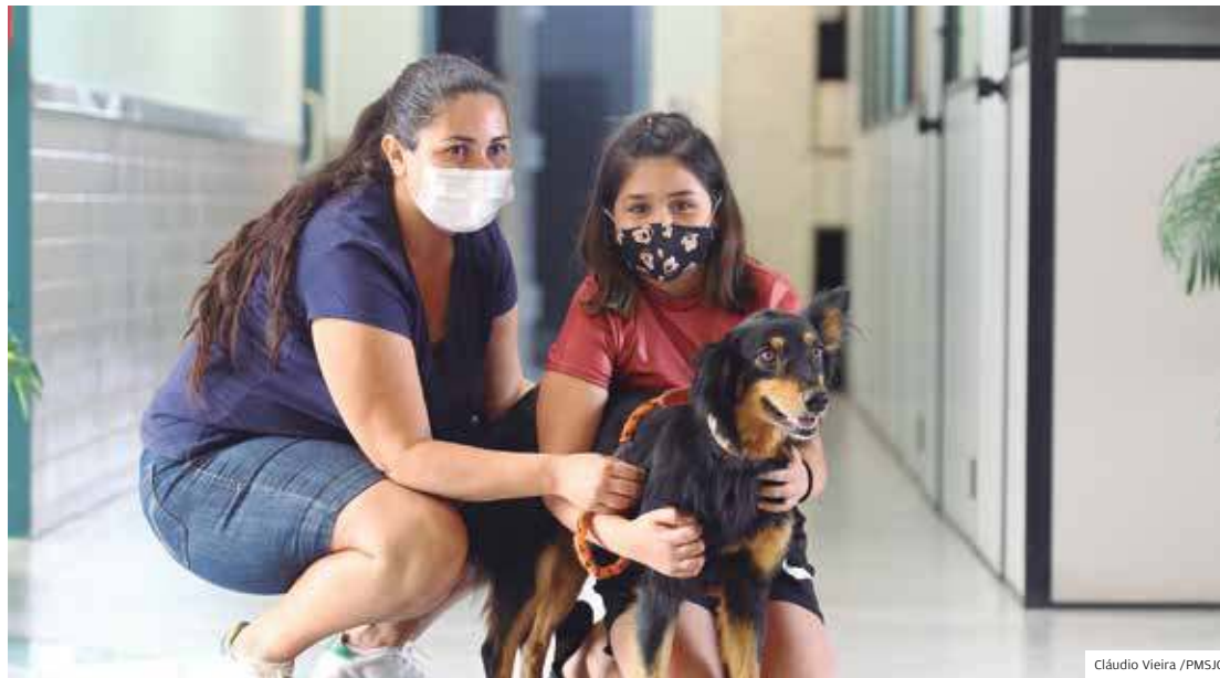
Atendimento. No local, serão oferecidos procedimentos clínicos, cirúrgicos e de diagnóstico para pets

A unidade hospitalar oferece atendimento aos animais de tu-