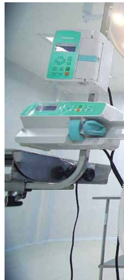
Estrutura. Hospital Veterinário Público

A parceria firmada com a Univap foi realizada mediante concorrência pública. O hospital dispõe de uma infraestrutura com 6 consultórios para atendimento clínico, além de dois centro cirúrgicos bem equipados para realização de diferentes tipos de cirurgias.