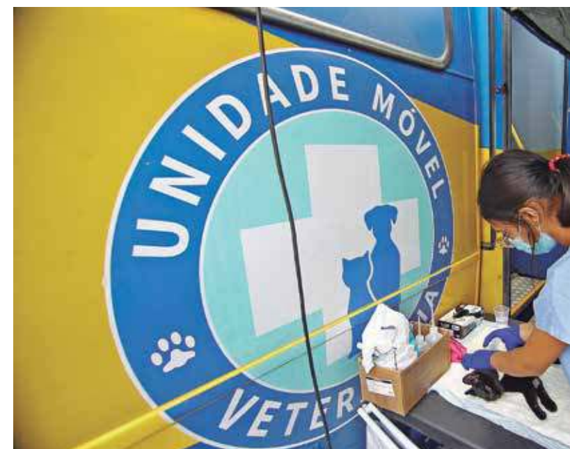
Castramóvel. As castrações realizadas pelo Castramóvel integram o Meu