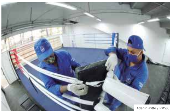
Instalações. Funcionários montam ringue de boxe