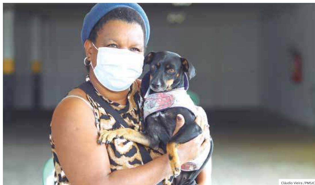
Nos bairros. Castramóvel tem capacidade para atender até 7 animais ao mesmo tempo na cidade