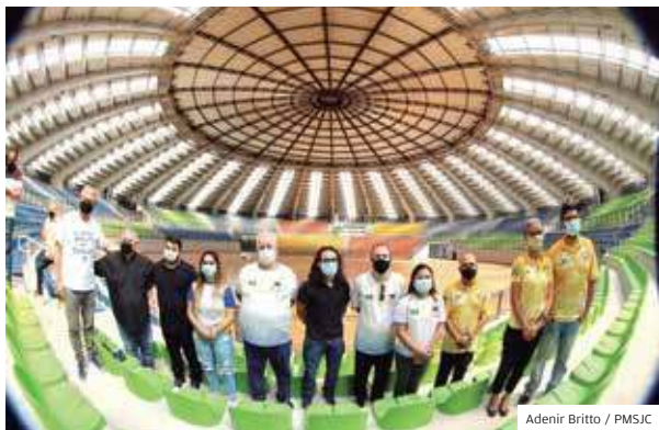
Moderno. Teatrão foi visitado em 23 de agosto

COMPETIÇÃO DIRIGENTES CONFEDERAÇÃO BRASILEIRA DE DESPORTOS DE SURDOS APROVAM LOCAIS DE COMPETIÇÃO EM SÃO JOSÉ DOS CAMPOS