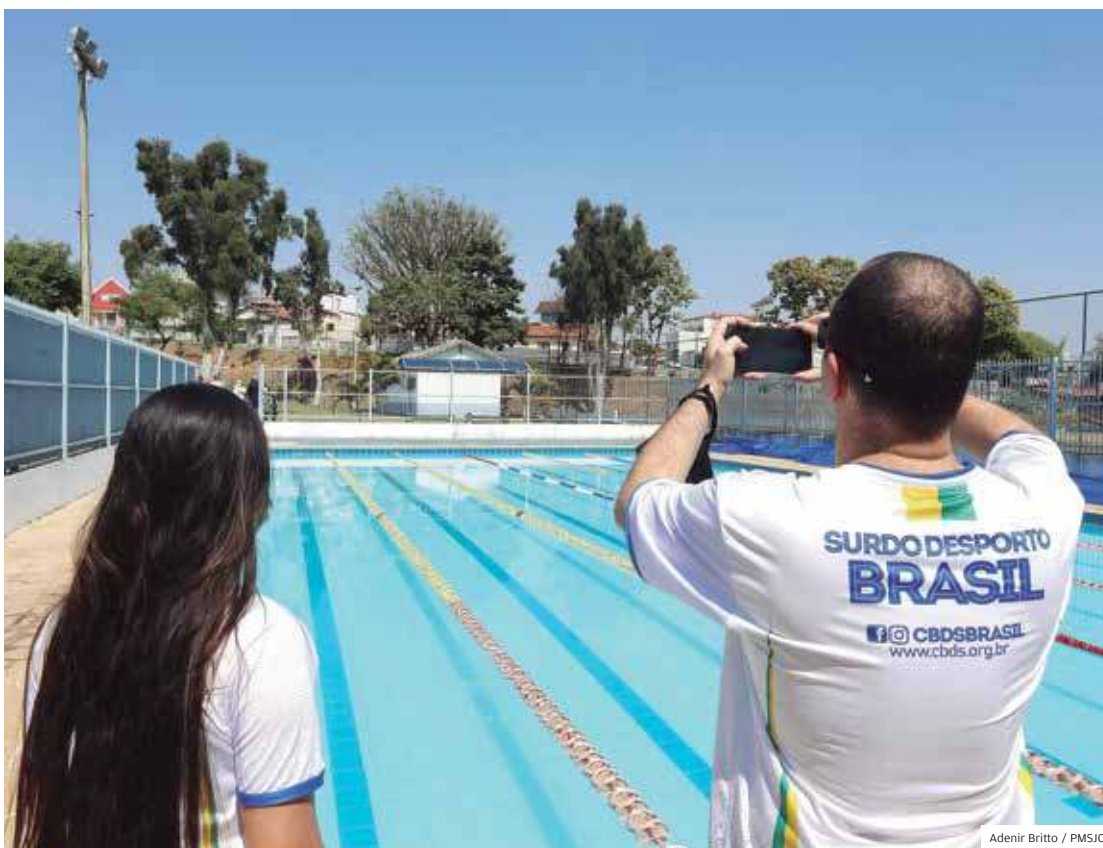
Vistoria. Dirigentes elogiaram as instalações e disseram ter convicção que evento será um sucesso

A competição terá 15 modalidades em disputa: atletismo, badminton, basquete, ciclismo de estrada, handebol, judô, karatê, mountain bike, boliche, natação, taekwondo, tênis de mesa, vôlei, vôlei de praia e xadrez.