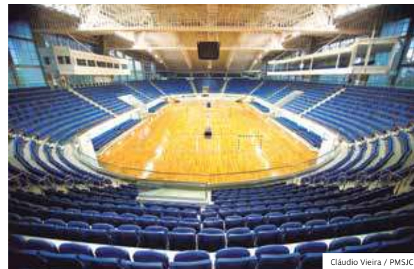
Nova. Arena de Esportes, no Jardim das Indústrias