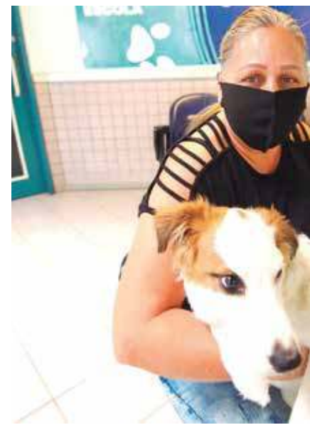
Marcação. atendimentos são realizados