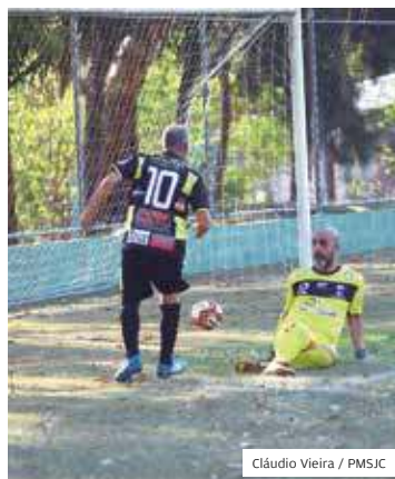
Futebol. Bola voltou a rolar

RETORNO. Depois de um ano e cinco meses, a bola voltou a rolar em cerca de 40 dos 60 campos de futebol espalhados em todas as regiões. A retomada do futebol amador, em 21 de agosto, está sendo feita seguindo os protocolos sanitários de combate à covid-19. Entre eles, estão a realização de apenas jogos amistosos para evitar a aglomeração.