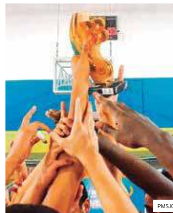
Fundo. Mudança positiva

LEGISLAÇÃO. A Câmara aprovou por unanimidade o projeto de lei da Prefeitura que institui o Fajedj (Fundo de Apoio ao Desporto Joseense). O novo fundo visa adequar a legislação municipal de fomento ao esporte, modernizando a atual lei que trata do Fadenp (Fundo de Apoio ao Deporto não Profissional).