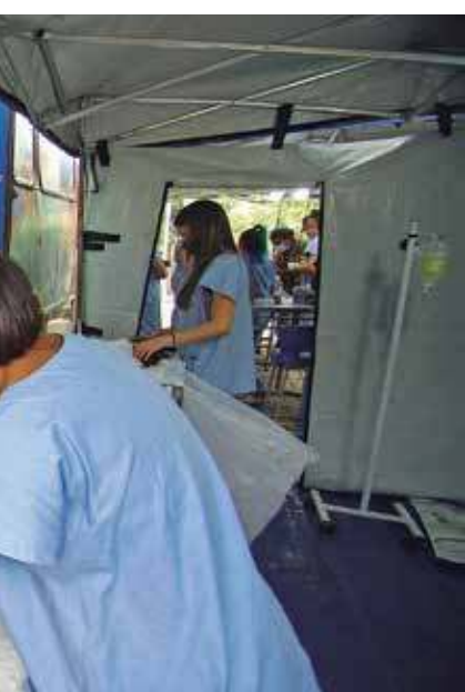
Cláudio Vieira /PMSJC

Parceria. Hospital foi viabilizado por meio de um convênio com a Universidade do Vale do Paraíba