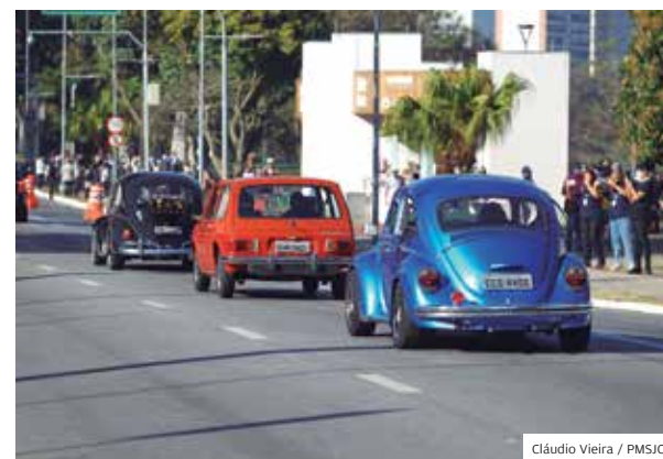
Motor. Carros antigos foram atração na região central

Foi um dia inteiro para sentir como é bom viver em São José. Atividades ao ar livre e com distanciamento entre as pessoas marcaram o aniversário de 254 anos da cidade, no último dia 27 de julho.