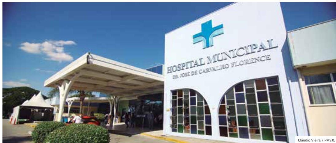
HM. De 1º a 20 de julho foram realizadas 411 cirurgias, número que superou o planejado para o mês

EMPENHO GRAÇAS AO ESFORÇO DE 260 PROFISSIONAIS DOS CENTROS CIRÚRGICOS, DEMANDA REPRESADA PELA PANDEMIA GANHA FLUIDEZ