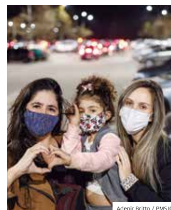
Drones. Bom público no Cefe

Luzes. Os 254 anos de São José foram comemorados com um show de luzes por drones na noite de 26 de julho. No céu da cidade, os desenhos e as cores encantaram a cada movimento. O espetáculo durou cerca de dez minutos, tempo suficiente para surpreender todos os espectadores. No estacionamento do Cefe não sobrou nenhuma vaga.