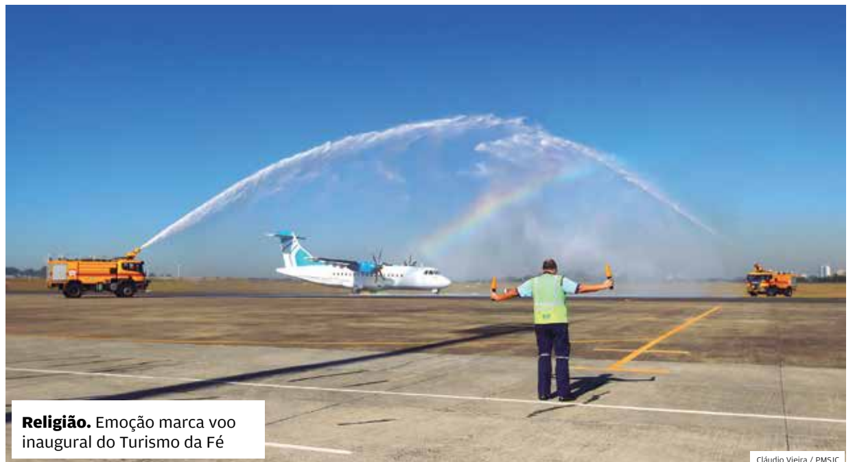
Religião. Emoção marca voo inaugural do Turismo da Fé