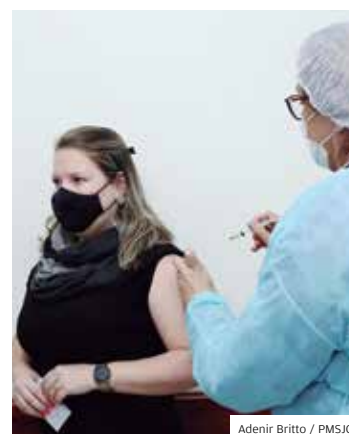
Grupo. Jovens vacinados

Aplicação. Aproximando-se da imunização parcial de 80% da população, a Prefeitura de São José dos Campos fechou o mês de julho com a aplicação da 1ª dose contra a covid para os jovens de 28 anos e 27 anos. Para os grupos prioritários que ainda não receberam a 1ª dose, o rescaldo continua a ser feito em unidades específicas do município.