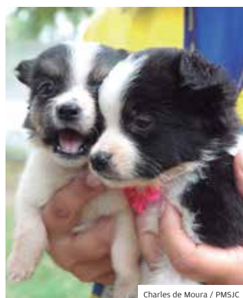
Internet. Inscrição no site

Inscrições. O mês de agosto chega com boas notícias para a saúde dos amigos de quatro patas. No dia 3, às 9h, a Prefeitura vai abrir as inscrições para o programa Meu Pet Feliz. Nesta 12ª edição, serão oferecidas 1.000 vagas para a castração de cães e gatos. As inscrições poderão ser feitas no site da Prefeitura de São José dos Campos.