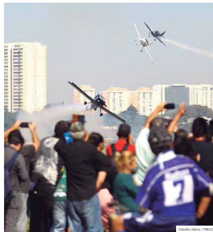
Aviões. Esquadilha CEU aconteceu em dois horários no dia 27

Serão beneficiados com a pista de bicicross que foi totalmente reformada pela Prefeitura de São José