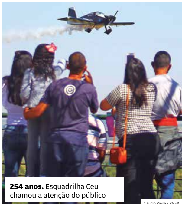
254 anos. Esquadrilha Ceu chamou a atenção do público

São José se consolida como um dos melhores lugares para se viver no país. Investimento em geração de renda, esporte e meio ambiente beneficia futuras gerações