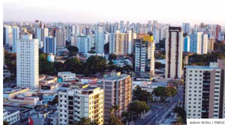
Adenir Britto / PMSJC

Foram avaliadas pelo grupo de especialistas contratado pela revista do grupo britânico