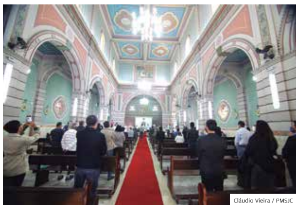
Fé. Matriz realizou a tradicional missa de aniversário

Um dia inteiro para sentir como é bom viver em São José. Atividades ao ar livre e com distanciamento social entre as pessoas marcaram o aniversário de 254 anos da cidade, comemorado no último dia 27 de julho