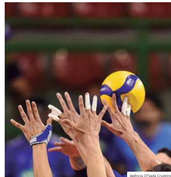
Brasil. Nova equipe jogará Paulista e Superliga