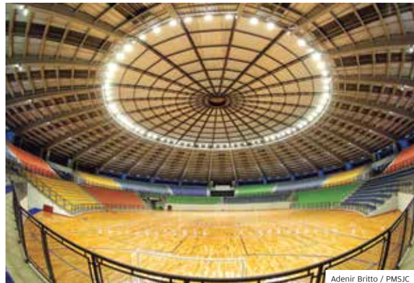
Iluminado. Teste de iluminação feito no Teatrão

BASE COMPLEXO DO TEATRÃO SERVIRÁ COMO UM CENTRO DE TREINAMENTO PARA AS EQUIPES DE BASE MANTIDAS PELO ATLETA CIDADÃO