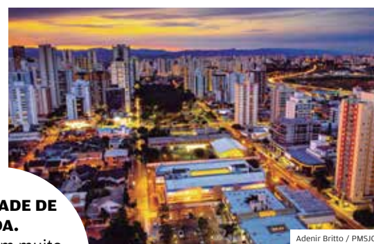
Adenir Britto / PMSJC

QUALIDADE DE VIDA. Cidade tem muito verde e centros de inovação, como o Parque Tecnológico