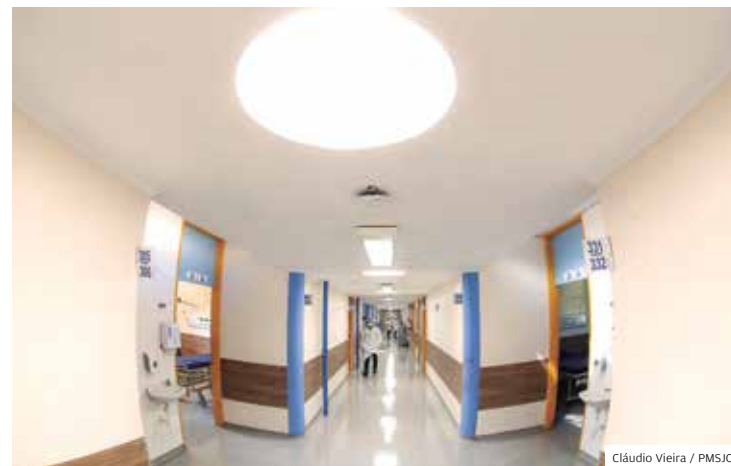
Estrutura. Corredores do HM, onde acontecem as cirurgias