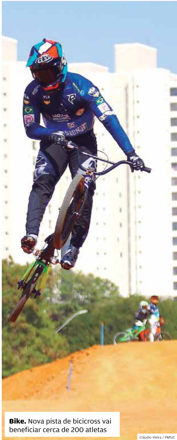
Bike. Nova pista de bicicross vai beneficiar cerca de 200 atletas

Informativo da Prefeitura de São José dos Campos • www.SJC.sp.gov.br