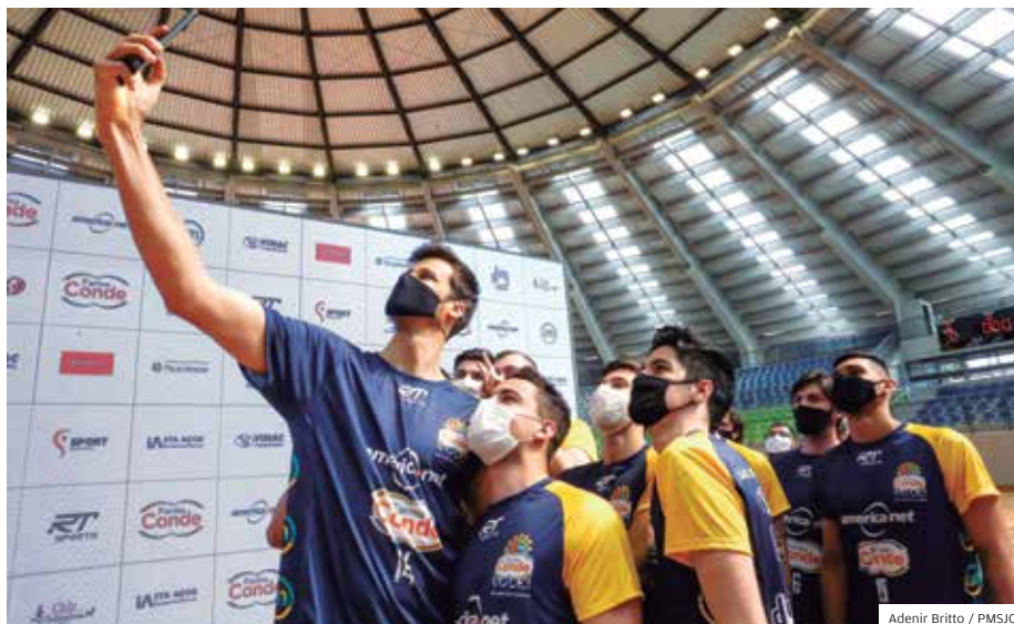
Alto rendimento. Jogadores do São José disputarão a elite do vôlei nacional

A última temporada foi marcada pelas principais façanhas do clube, que ficou na terceira colocação do Campeonato Paulista e alcançou o histórico quarto lugar na Superliga A superando o Cru-