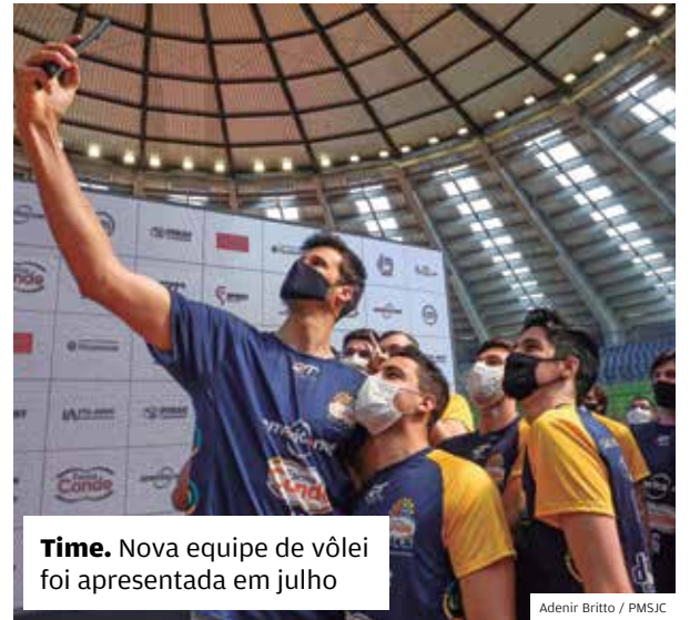
Time. Nova equipe de vôlei foi apresentada em julho