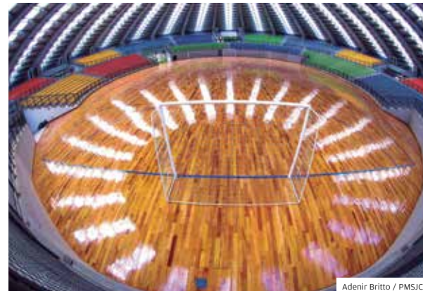
Times. Atletas da base atuarão no novo espaço