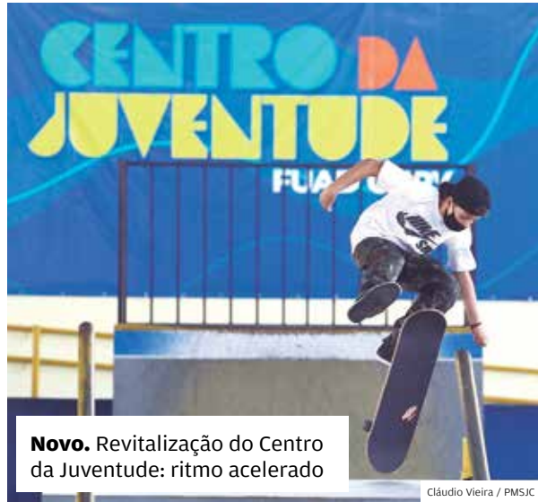
Novo. Revitalização do Centro da Juventude: ritmo acelerado