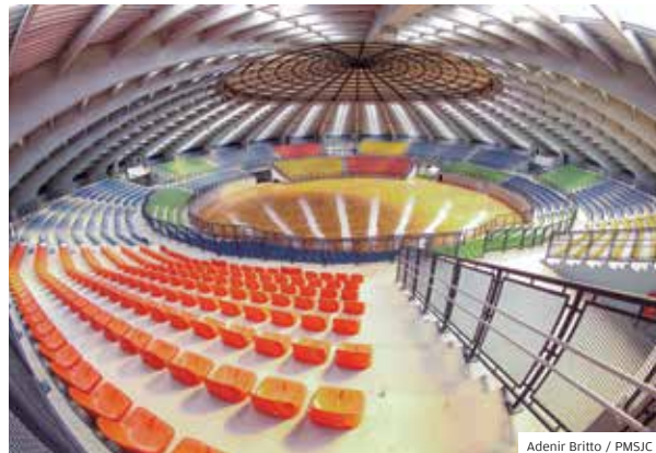
Capacidade. Local comporta 4.000 pessoas sentadas