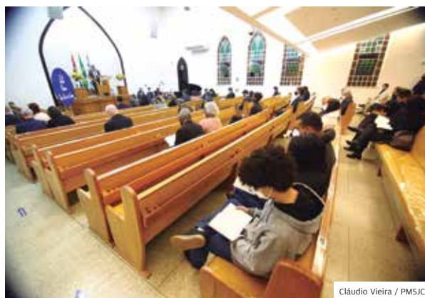
Oração. Culto realizado na Igreja Cristã Evangélica