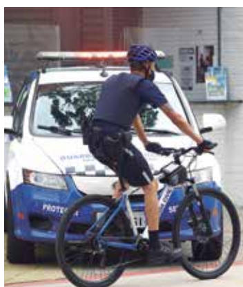
GCM. Guardas nas ruas

Positivo. Com novos programas e investimentos, uso de tecnologia e união de forças, a segurança pública de São José dos Campos alcançou neste mês 77,7% de aprovação positiva (ótimo, bom e regular), de acordo com pesquisa Indsat (Indicadores de Satisfação dos Serviços Públicos). Os índices de criminalidade vêm caindo mês a mês desde 2019.