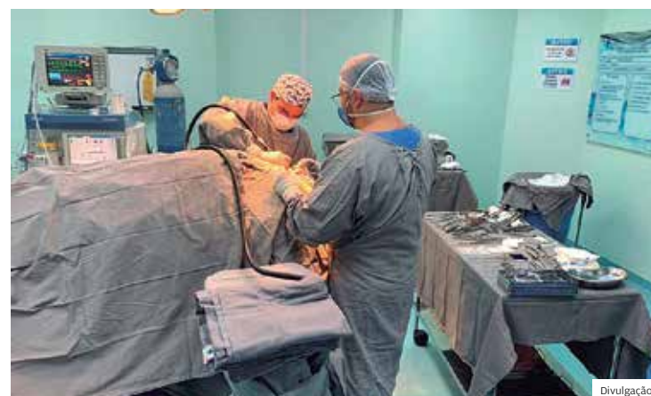
Agenda. As cirurgias acontecem entre segunda e sexta, até 22h

A taxa de ocupação dos leitos exclusivos para covid nos hospitais públicos e privados de São José dos Campos caiu a menos de 50% na UTI e a menos de 30% na enfermaria. No Hospital Municipal, o percentual é ainda menor.