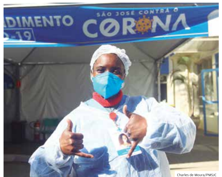
Bom humor. Alegria de funcionários também ajuda na reabilitação