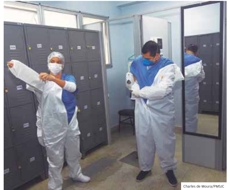
Bastidores. No vestiário, funcionários se apertam para trabalho