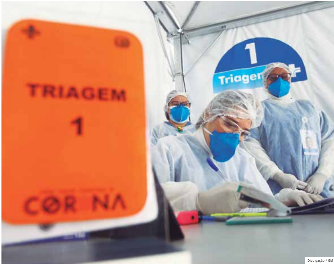
Recepção. Na tenda da triagem, entram em ação as recepcionistas e médicos para dar todo o suporte