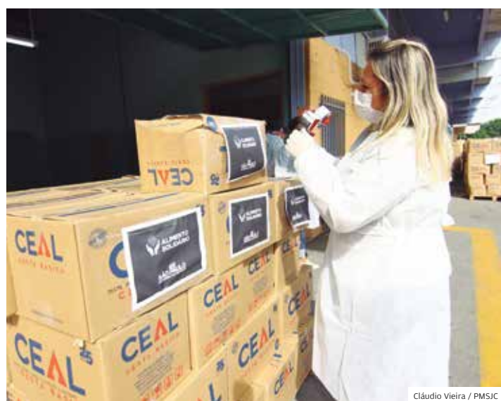
Estado. Governo do Estado encaminhou para São José 29 mil cestas básicas para famílias que vivem em situação de pobreza

General Motors e Veibrás cederam veículos para o trabalho nas ruas. A Urgo Medical doou cerca de uma tonelada de álcool gel. O governo estadual também forneceu 29 mil cestas básicas.