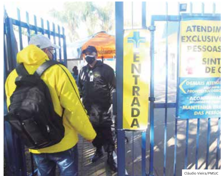
Vigilância. Profissionais da segurança recepcionam o cidadão