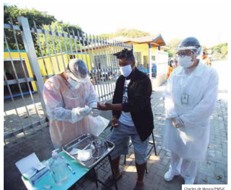
Teste. Médicos já realizaram testes rápidos na população de rua