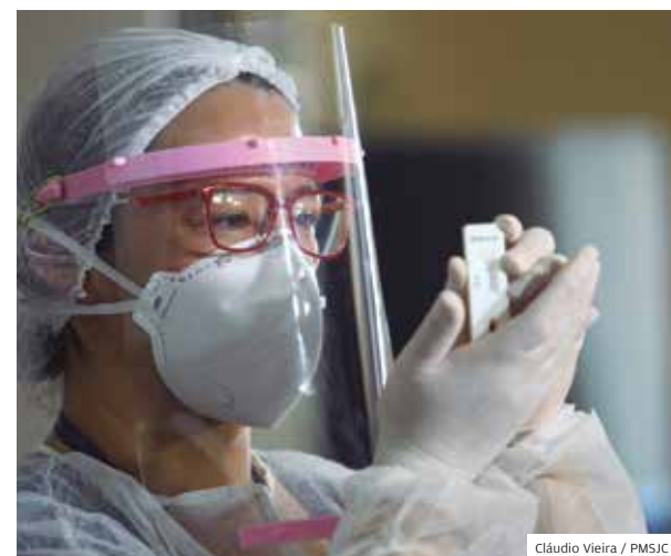
Testes. Prefeitura recebeu doação de testes rápidos