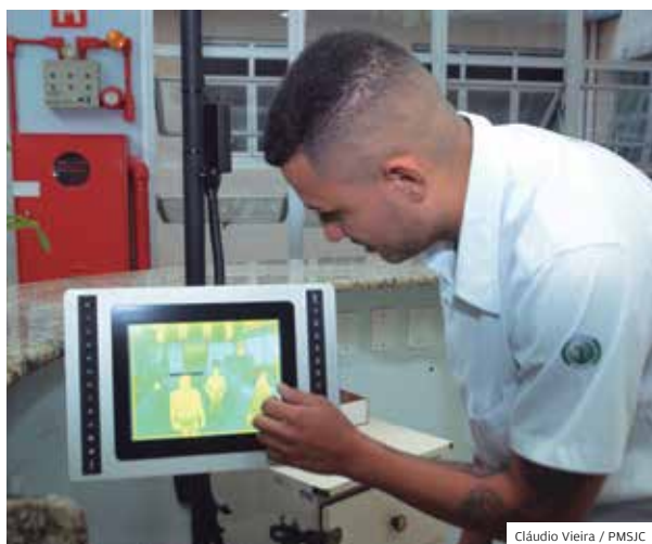
Febre. Câmera doada monitora temperatura corporal

Prefeitura de São José dos Campos amplia a transparência na divulgação dos investimentos realizados durante a pandemia de coronavírus; todos os investimentos são divulgados no Portal da Transparência