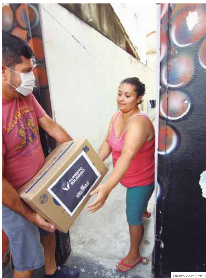
Entrega. Motoristas de vans fizeram a distribuição das cestas

Mil Cestas básicas foram doadas pelo governo estadual para serem distribuídas a famílias que vivem em situação de extrema pobreza em São José dos Campos