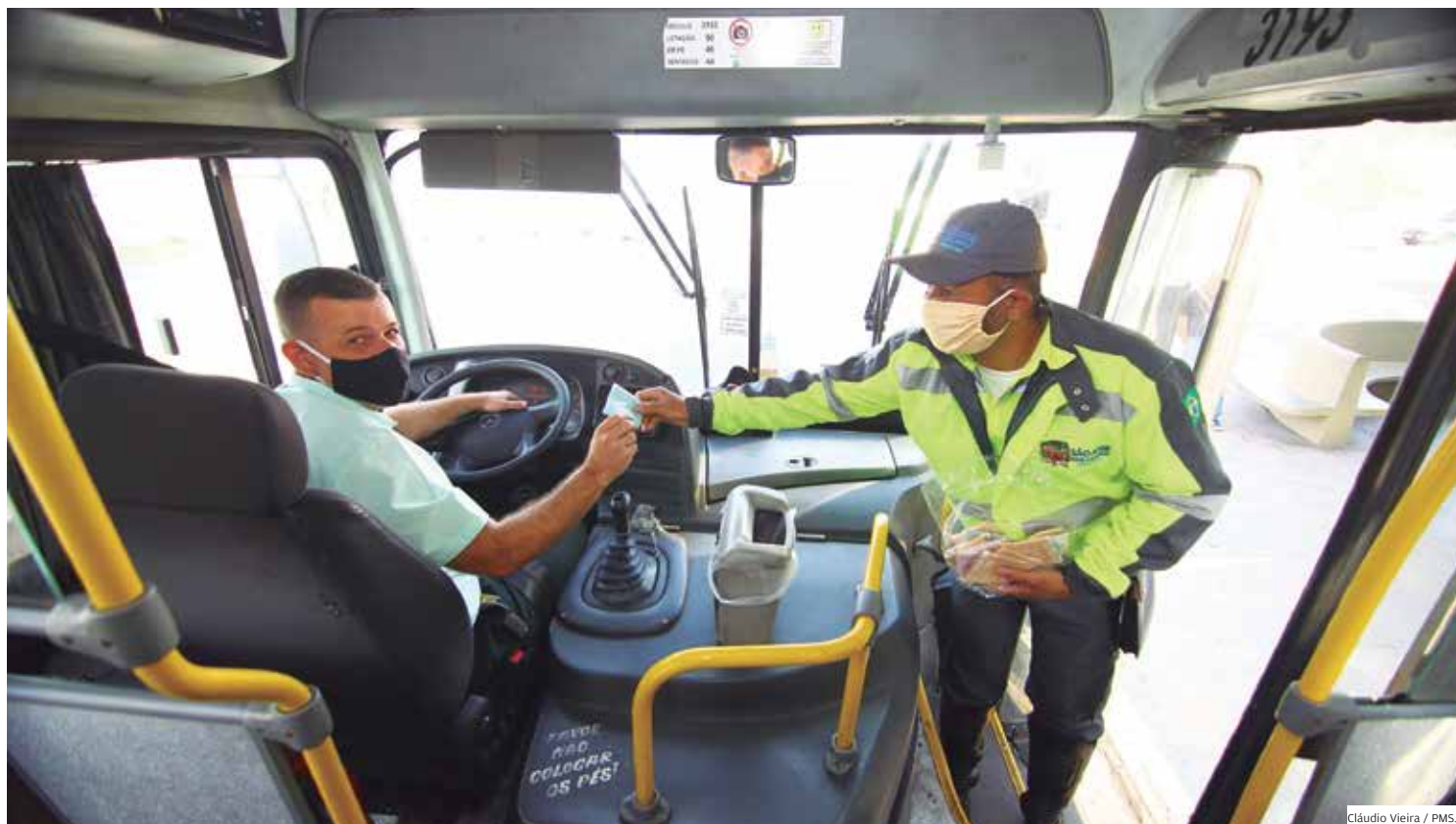
Segurança. Prefeitura distribuiu máscaras para toda a população, o que contribuiu para evitar a disseminação do coronavírus na cidade

O decreto estabelece obrigações como utilização de máscara descartável ou de tecido por todos os funcionários e clientes; disponibilização de frasco com álcool em gel 70% na entrada e na saída do estabelecimento; higienização frequente ou a proteção para facilitar a higienização das superfícies de toques; limpeza e desinfecção frequente dos sistemas de ar-condicionado; garantia de circulação de ar com, no mínimo, uma porta ou uma janela abertas; caixas e guichês, preferencialmente, com proteção de vidro ou policarbonato para separar