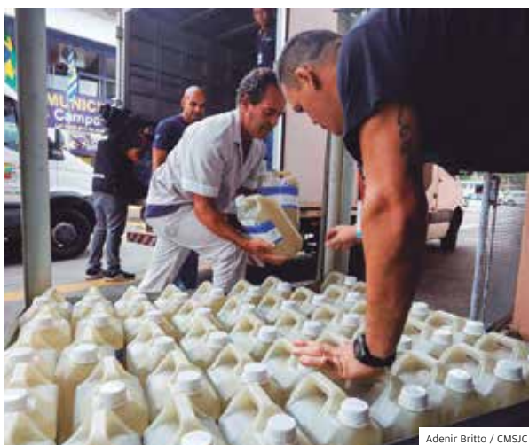
Higiene. Empresa doou 1 tonelada de álcool gel