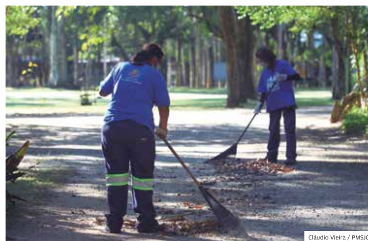
Cartão-postal. Parque da Cidade está com a manutenção em dia

No Santos Dumont também foram executados vários serviços como a pintura das duas portarias, do piso da academia ao ar livre e das áreas onde ficam as réplicas de aviões e foguetes.