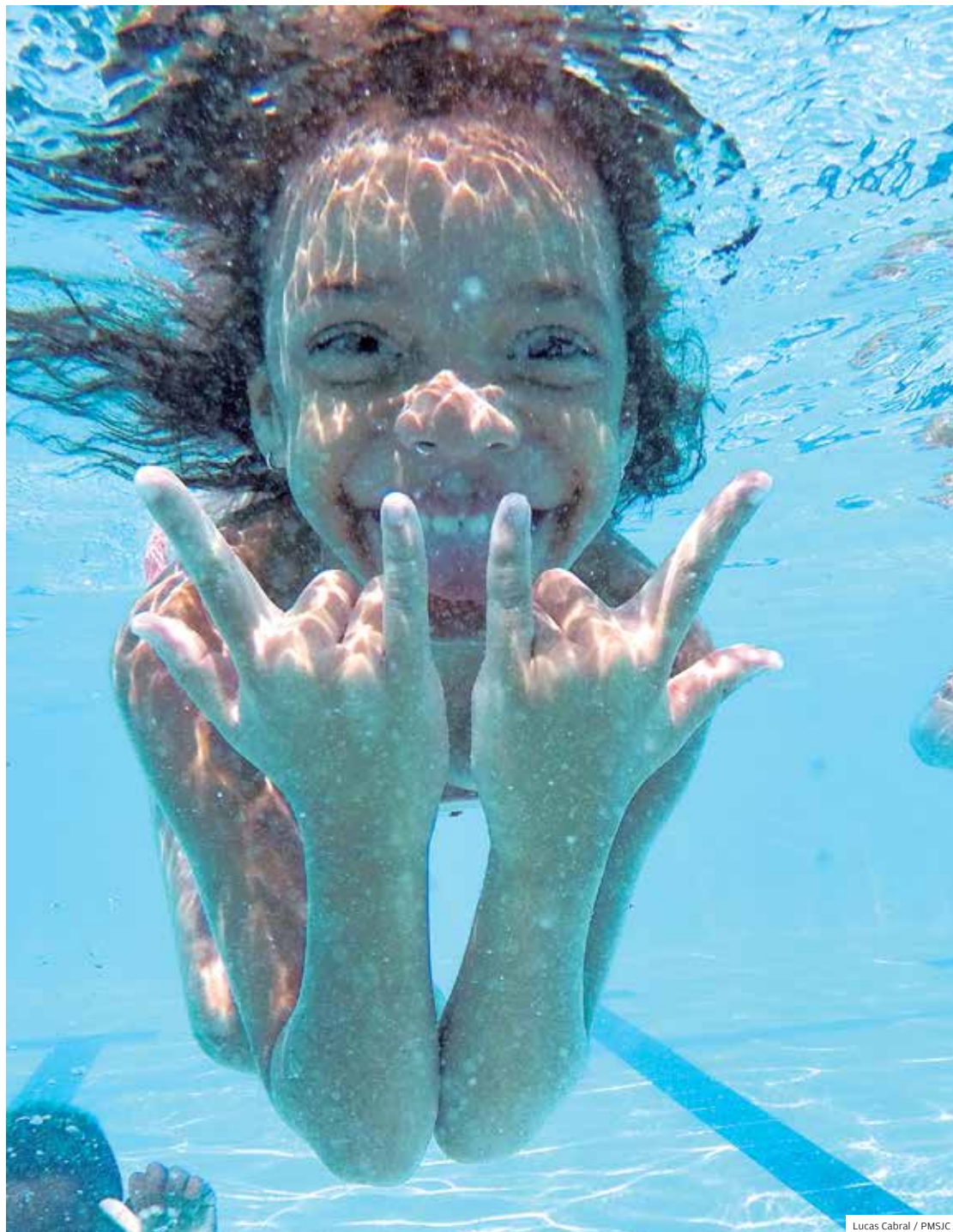
Lucas Cabral / PMSJC