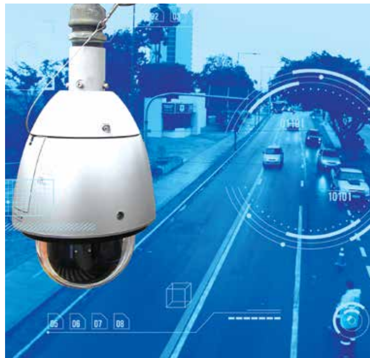
CSI. Imagens de todas as câmeras ficarão interligadas ao CSI

As imagens contemplarão o serviço de inteligência que possibilitará ainda o reconhecimento facial e leitura de placas de veículos. As imagens serão salvas com data, hora e local, possibilitando registrar ocorrências em tempo real.