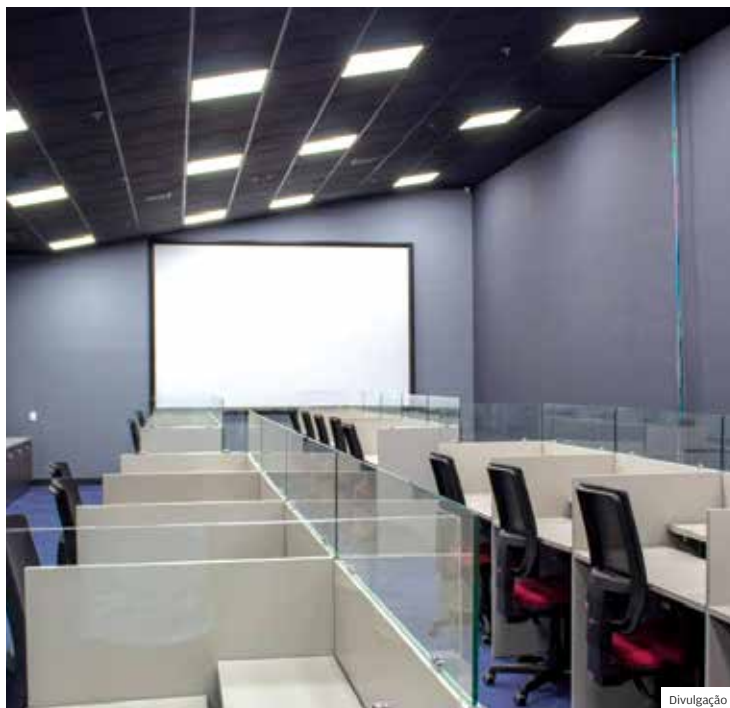
Estrutura. Espaço onde irá funcionar o CSI, no Parque Tecnológico

Atualmente, a cidade possui 493 câmeras de vigilância, que serão substituídas pelas novas câmeras e permitirão que o sistema de monitoramento chegue aos extremos da cidade e a bairros distantes da região central.