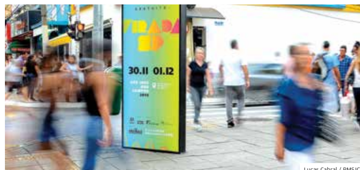
Lucas Cabral / PMSJC

comemora o Dia de Doar. Há um mês, mais de 100 entidades cadastradas pelo Fundo Social divulgam suas necessidades no site Doa São José.