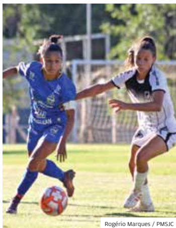
Olho no lance. Futebol feminino também foi a Marília