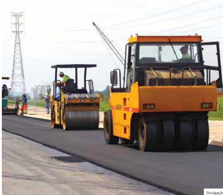
Mão na massa. Operários usam asfalto ecológico na Via Cambuí

A exigência por este tipo de tecnologia fez parte da licitação das respectivas obras e é autorizada pela Lei Municipal 6.961, de 9 de abril de 2018. No ano passado, o asfalto eco-