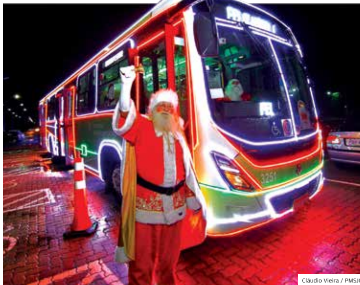
Alegria. Papai Noel chegou ao centro no dia 22 de novembro

“Muito legal. As crianças estão super ansiosas para chegar na casinha dele, só falam nis-