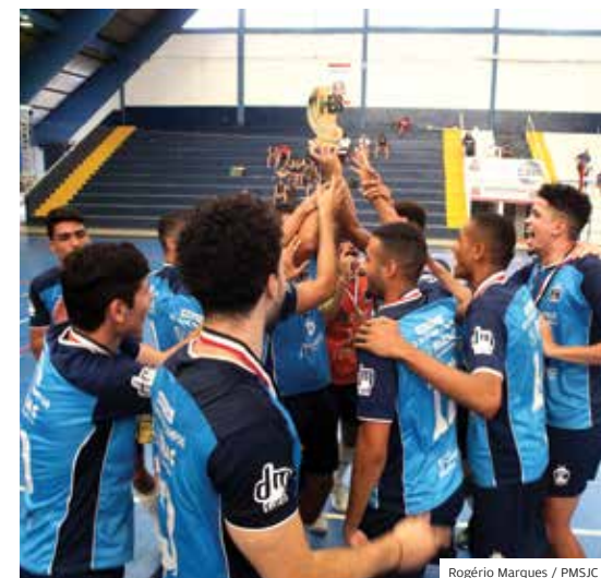
Pontuação. São José somou 249 pontos