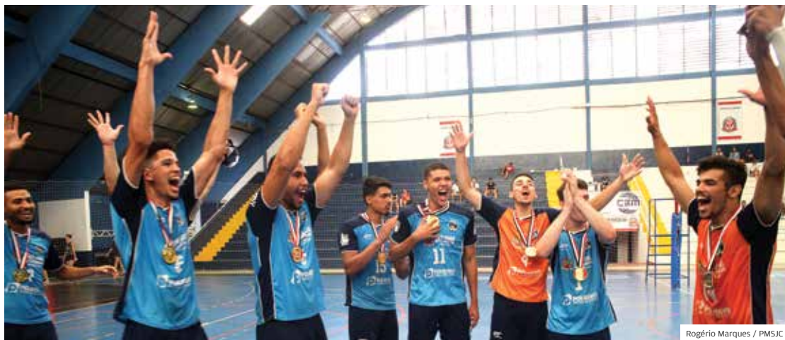
Festa. Voleibol masculino fez bonito em Marília e garantiu medalha nos Jogos Abertos do Interior