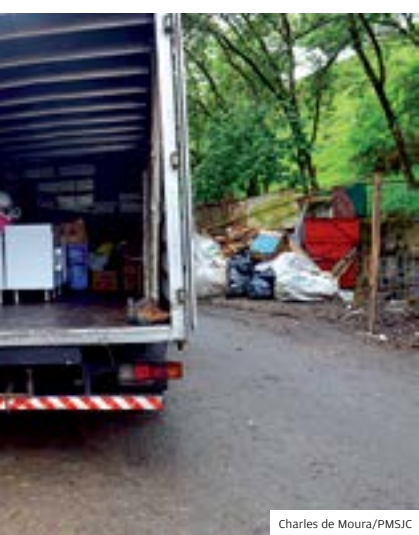
Charles de Moura/PMSJC