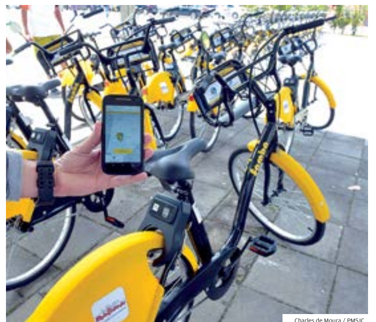
Charles de Moura / PMSJC