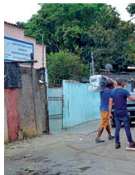
Força. Prefeitura dá apoio financeiro n