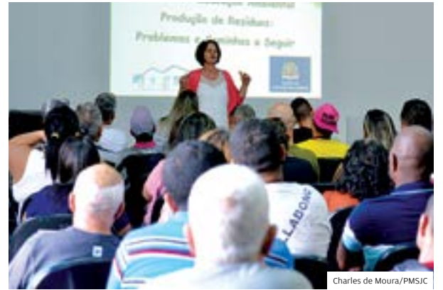
Charles de Moura/PMSJC

Qualificação. Bolsistas em oficina de Hortas Urbanas