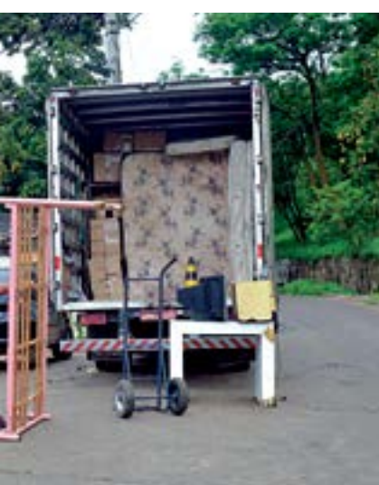
Charles de Moura/PMSJC