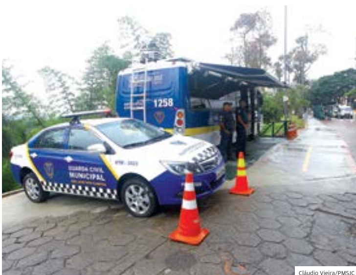
Segurança. Base da Guarda garante a segurança na região central