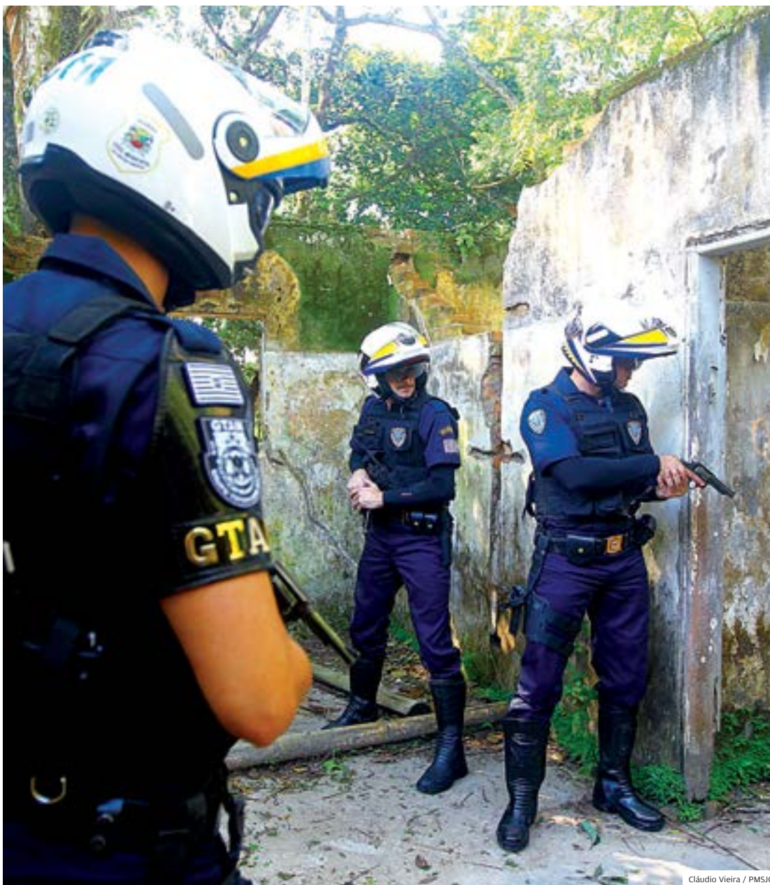
Intensivo. Guardas recebem treinamento antes de ir às ruas da cidade: GCM é referência na região

passará a ter a Guarda Civil Municipal após a convocação dos aprovados em concurso público aberto pela Prefeitura