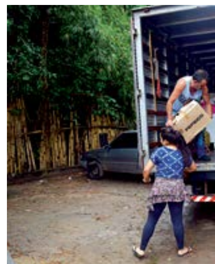
Saída. Moradores fazem a mudança em