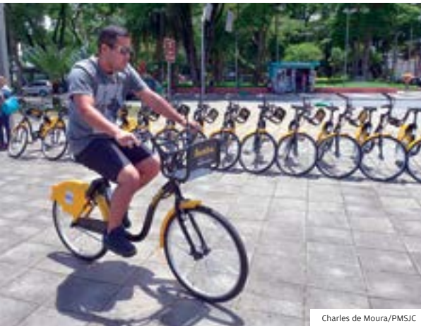
Charles de Moura/PMSJC

MOBILIDADE BICICLETAS PODERÃO SER UTILIZADAS TODOS OS DIAS DA SEMANA, NO PERÍODO DAS 6H ÀS 23H